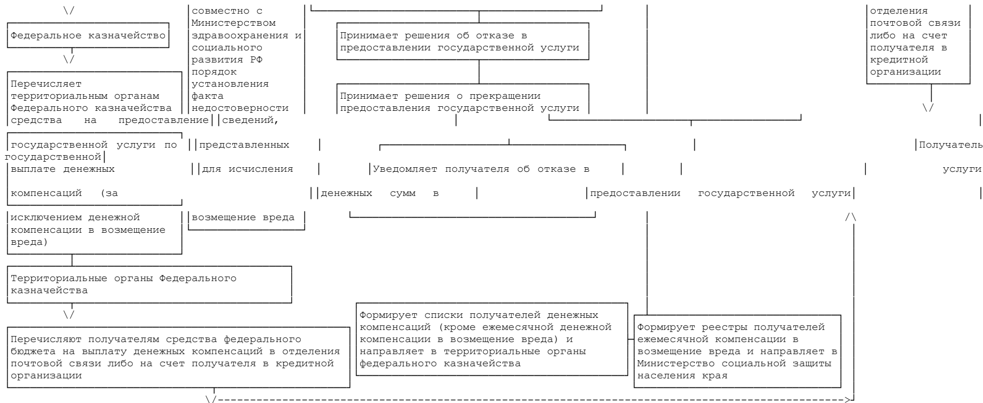
Приложение N 4 к Административному регламенту министерства социальной защиты населения Хабаровского края по предоставлению государственной услуги по назначению и выплате денежных компенсаций гражданам, подвергшимся воздействию радиации