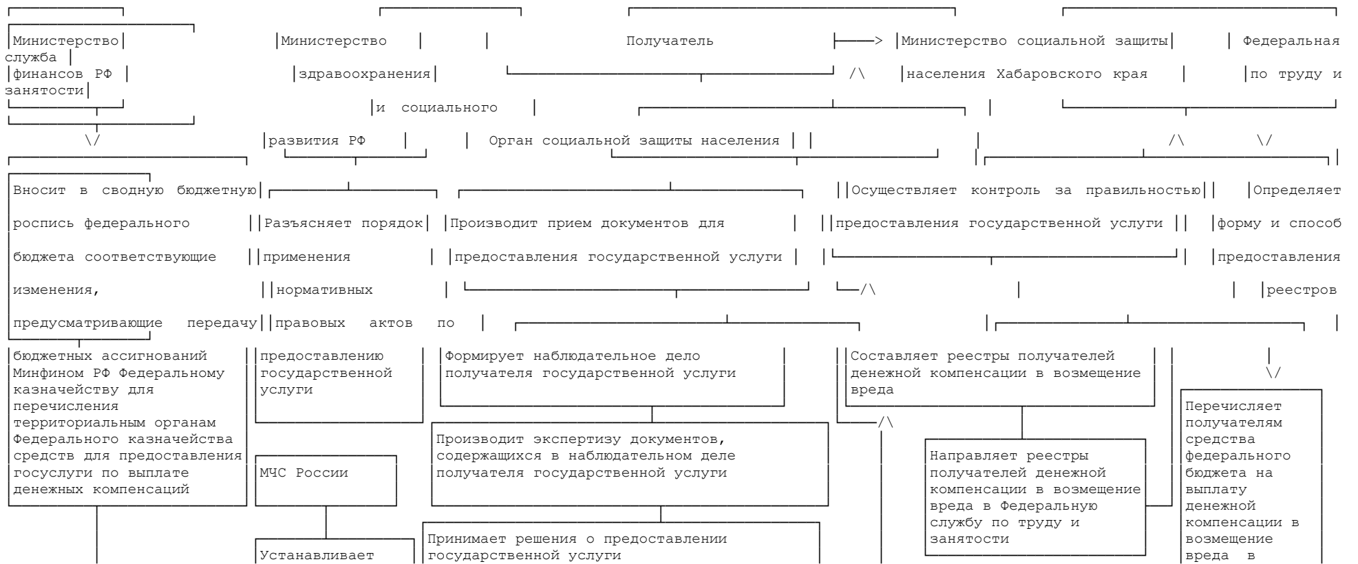
СХЕМА ПРЕДОСТАВЛЕНИЯ ГОСУДАРСТВЕННОЙ УСЛУГИ