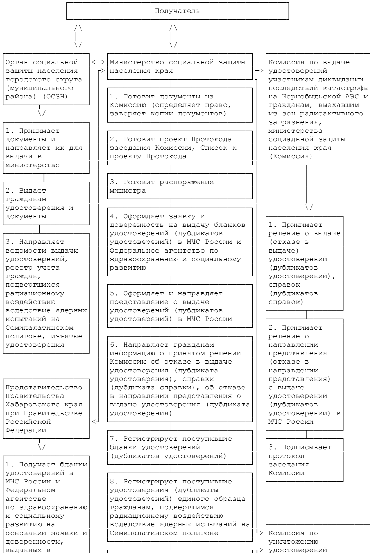
СХЕМА ПРЕДОСТАВЛЕНИЯ ГОСУДАРСТВЕННОЙ УСЛУГИ