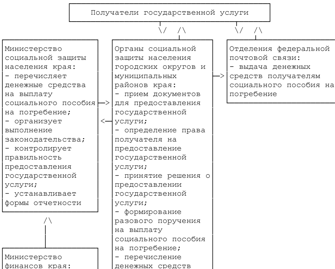
СХЕМА ПРЕДОСТАВЛЕНИЯ ГОСУДАРСТВЕННОЙ УСЛУГИ ПО НАЗНАЧЕНИЮ И ВЫПЛАТЕ СОЦИАЛЬНОГО ПОСОБИЯ НА ПОГРЕБЕНИЕ